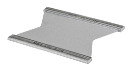
Plaque de maintien Roxtec

Pour plus d'informations, veuillez consulter roxtec.com .